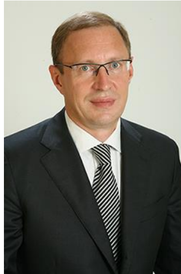
Самойлов Дмитрий Иванович Глава администрации города Перми