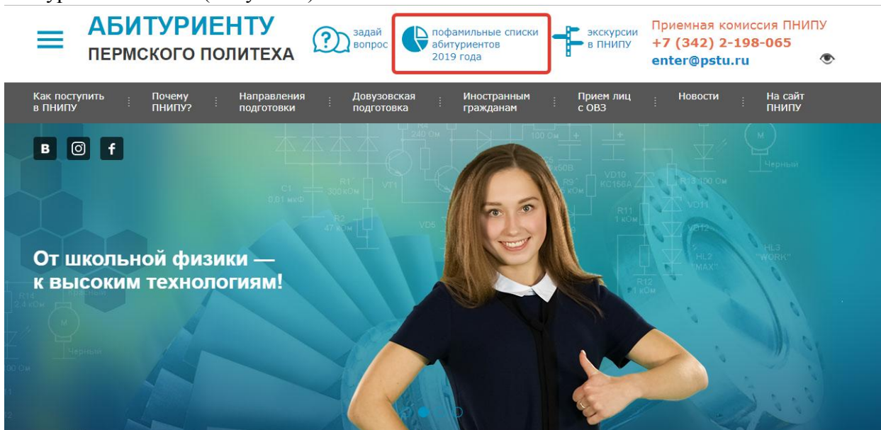
Рисунок 2. Пофамильные списки абитуриентов 2019

Вы будете перенаправлены в раздел сайта, созданный специально для абитуриентов Политеха. Далее, необходимо нажать на ссылку «Пофамильные списки абитуриентов 2019» (Рисунок 2)